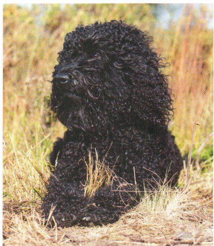
Links: Distel apporteert graag, zoals deze nep-eend. Midden: Toutes is acht jaar en bijzonder zachtaardig. Ze is heel lief naar mensen, kinderen en andere honden. Rechts: Lola is een tweeënhalf jarige rustige, blij en aanhankelijke hond met opvallende zwart met witte voorpoten en zwart-wit op de borst.

D uizenden opspringende krullen, daar bestaat zijn kop uit. Met daartussen twee glinsterende ogen en in het midden een bungelende roze tong. De blaf is vrolijk: barbets houden van plezier maken. Ze vinden het heerlijk om onbekommerd rond te rennen. Toch zijn ze ook met één flinke wandeling per dag prima tevreden. Daarbij verliezen ze hun baasje nooit uit het oog.