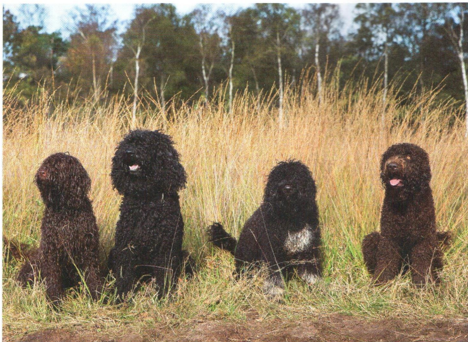
V.l.n.r.: Chablis is anderhalf, een evenwichtige zelfstandige hond. Daarnaast Toutes, Lola en Distel. Foto rechts: pup Peddels.